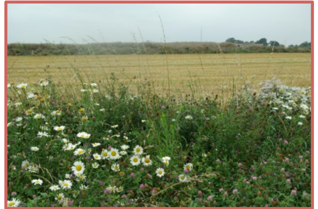
Exemple de prairie fleurie

À la suite du semis et si la « protection » de la prairie a bien été respectée, celle-ci commence à prendre forme la première année pour poursuivre son évolution les années suivantes.