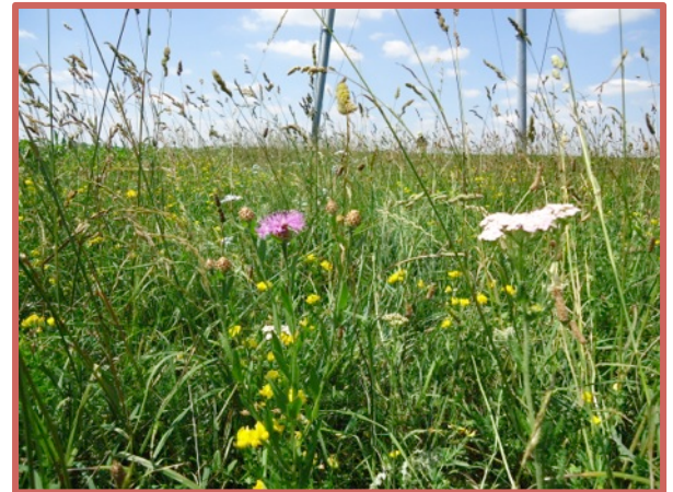
Prairie fleurie semée

L'intérêt de ce type de mélange est de proposer une composition avec moins de graminées et plus de plantes à fleurs. En effet, cela permet de favoriser les pollinisateurs et la petite faune (graine) tout en ayant un visuel plus attrayant.